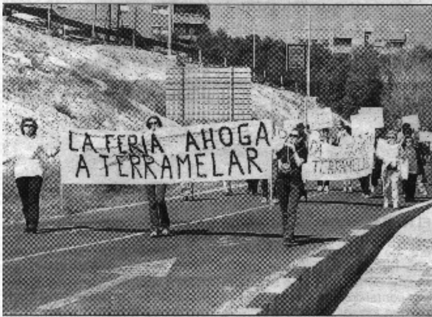
Protesta por el tranvía en Terramelar

Puedes hacer valer tu derecho a manifestar tus quejas: tan sólo tienes que rellenar con tus datos personales la instancia que acompaña al Boletín N° 8 y entregarla en cualquiera de los dos buzones de la Asociación.